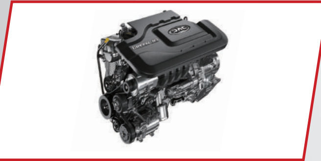
محرك 1,6 لتر VVT عالي الكفاءة