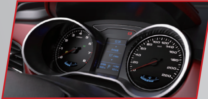
شاشة عرض السرعات والمعلومات المختصرة