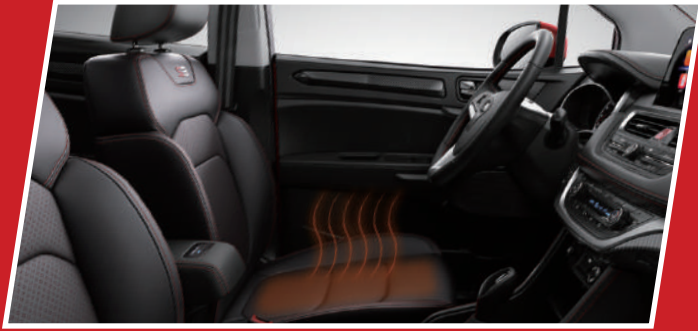
تدفئة مقعد السائق