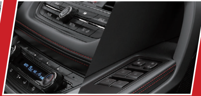
غطاء ناعم (للباب ولوحة التحكم)