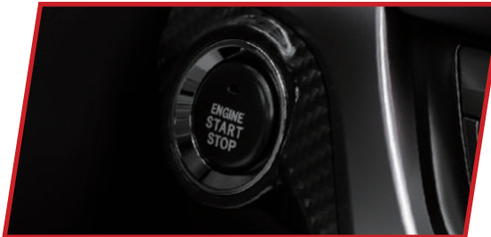
ادخل سيارتك، وانطلق بسلاسة!